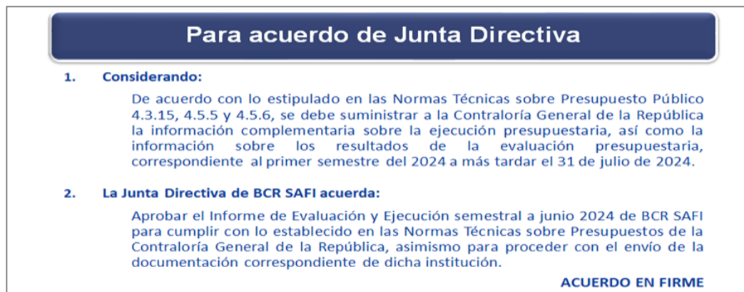
Imagen n.º8. Para acuerdo de Junta Directiva

Posteriormente, el señor Cuenca dice: “No veo consultas procederíamos entonces a tomar el acuerdo si les parece en firme, tal como está en pantalla (ver imagen n.º8).