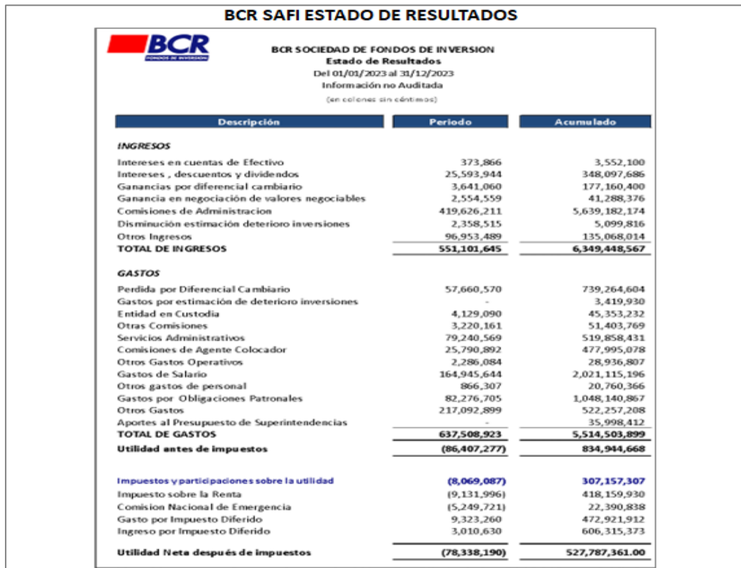
Imagen n.º7. BCR SAFI Estado de resultados

Al respecto, don Luis Ballestero menciona: “Seguidamente, tenemos lo que es el superávit presupuestario esto es la diferencia entre los ingresos y los egresos reales, en este caso nos da un superávit de ¢1.044.0 millones al cierre de diciembre (del 2023), esto a nivel de partidas de presupuesto (ver imagen n.º8)”.