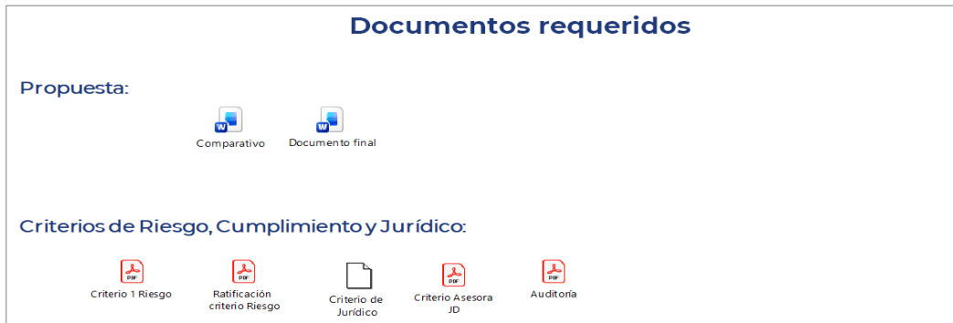
Imagen n.º5. Documentos requeridos