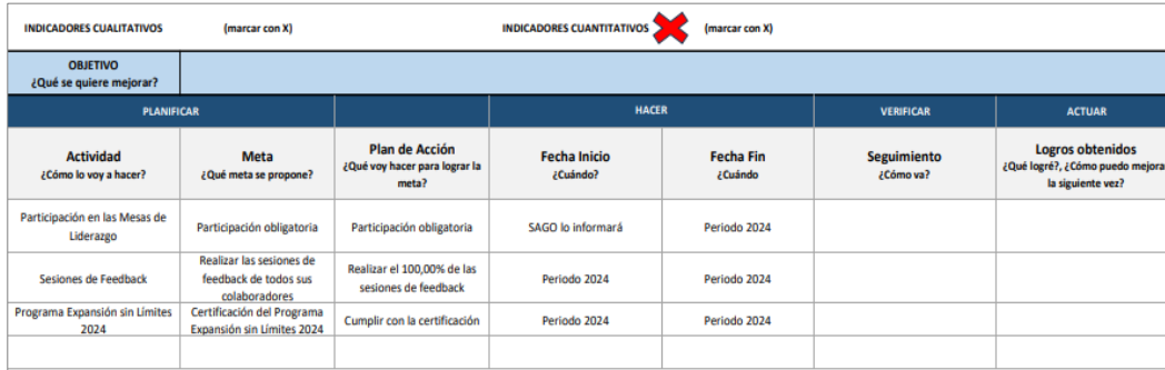
Imagen n.º2. Evaluación

participar. Por otro lado, tengo que hacer unas sesiones de feedback con los colaboradores en el periodo 2024, hacer el 100 % de esas sesiones que van a estar programadas y participar, cumplir con la certificación del programa Expansión sin límites (ver imagen n.º2). Siendo así, tal vez antes de pasar a la parte resolutive, yo deseo preguntarles a los señores directores ¿si tienen alguna consulta para mi persona?”.