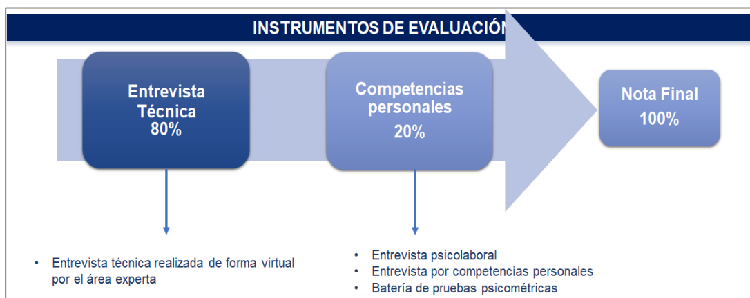
Imagen n.º5. Instrumento de evaluación