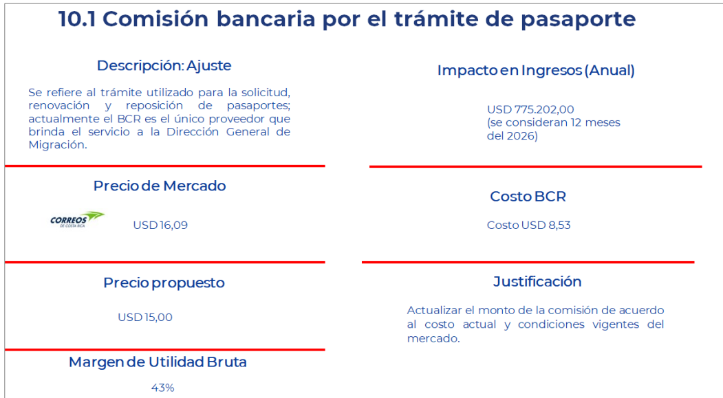
Imagen n.º7. 10.1 Comisión bancaria por el trámite de pasaporte

La comisión 10.1, comisión bancaria por el trámite de pasaporte. Aquí sería, el propósito es actualizar el monto de la comisión, de acuerdo con el mercado actual. En el mercado tenemos US$16.0 que, sería Correos (de Costa Rica), único competidor, el BCR propone US$15.0. El margen de utilidad es de 43 % y nos genera un ingreso aproximado a los US$775.000.0. Actualmente el costo que tenemos es de US$8.53 (ver imagen n.º7).