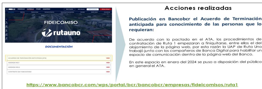
Imagen n.º3. Acciones realizadas

Otra acción que se hizo importante fue que se publicó en www.bancobcr.com el acuerdo de terminación anticipada para conocimiento de todas las personas que quisieran ver ese acuerdo y en qué consistía. Actualmente, ese acuerdo está en la página del Banco y ahí se detalla todas las acciones, todas las actividades que tiene que hacer la UAP del fideicomiso y el fiduciario para el finiquito de ese fideicomiso Eso quedó disponible al público a partir de enero del 2024 (ver imagen n.º3).