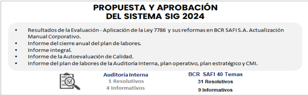
Imagen n.º8. Propuesta y aprobación del Sistema SIG 2024

En lo que corresponde a la Auditoría Interna, uno de los puntos es resolutivo y cuatro son informativos, para un total de 40 temas, 31 resolutivos y nueve informativos (ver imagen n.º8).