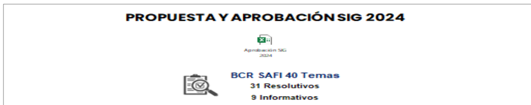
Imagen n.º9. Propuesta y aprobación SIG 2024