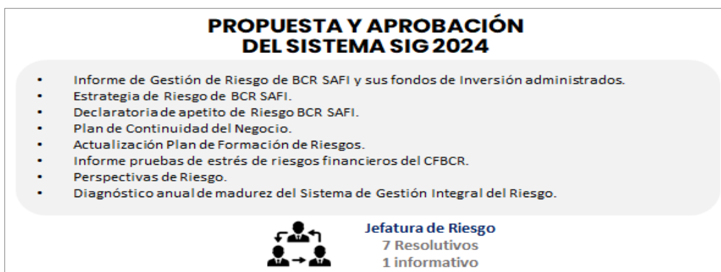
Imagen n.º5. Propuesta y aprobación del Sistema SIG 2024

En lo que corresponde a la Jefatura de Riesgo, tiene siete puntos resolutivos y uno informativo e igual se detalla en los bullets que se ven en la presentación (ver imagen n.º5).