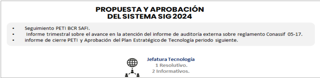
Imagen n.º6. Propuesta y aprobación del Sistema SIG 2024

ellos con respecto al PETI (Plan Estratégico de Tecnología) y el otro es con la atención de las auditorías externas, según el Conassif 05-17 (ver imagen n.º6).