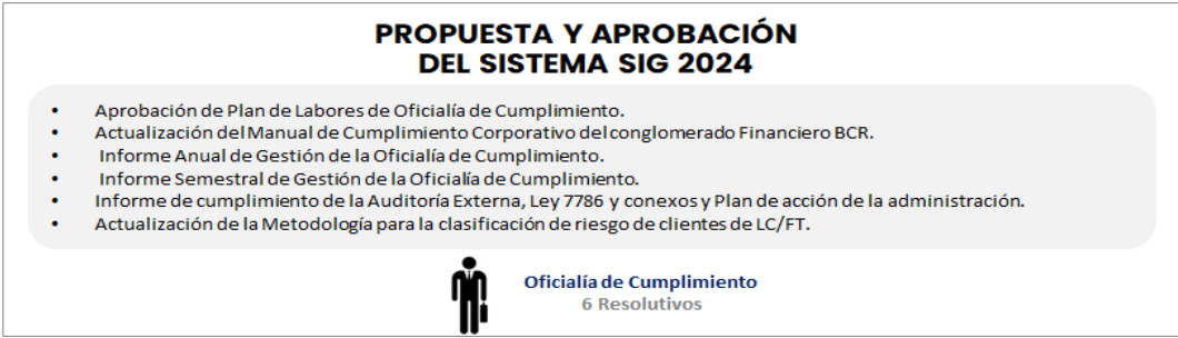
Imagen n.º7. Propuesta y aprobación del Sistema SIG 2024

En la Oficialía de Cumplimiento todos los puntos son resolutivos, de los cuales son seis de estos puntos (ver imagen n.º7).