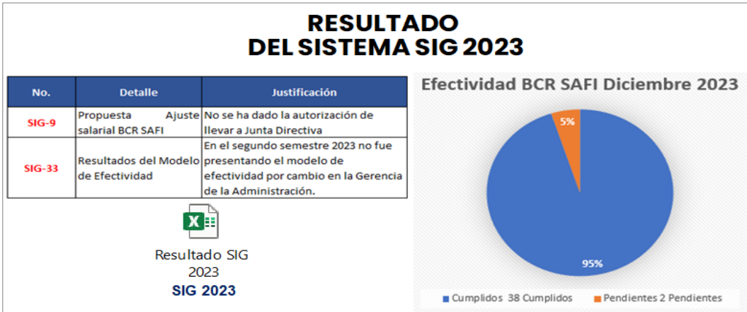
Imagen n.º2. Resultado del Sistema SIG 2023