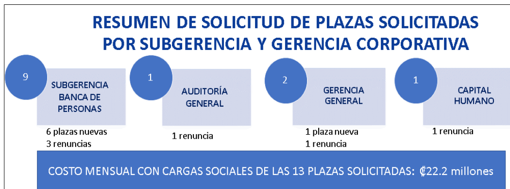
Imagen n.º2. Resumen de solicitud de plazas solicitadas por subgerencia y gerencia corporativa

Tenemos una cantidad de nueve plazas requeridas para la Subgerencia de Banca de Personas; de las cuales, seis pertenecen a plazas nuevas, tres a renunciadas, una de la Auditoría General (Corporativa), que corresponde a una renuncia; dos de la Gerencia General: una que es de (Oficialía) Cumplimiento, otra que es de Responsabilidad Social, que es una solicitud de una plaza nueva y una renuncia de Capital Humano (ver imagen n.º2). No sé si desean ver el detalle, si no, lo comentamos de modo muy general”.